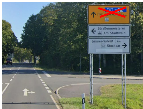
Anlage C 20