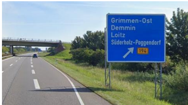
Anlage C 24