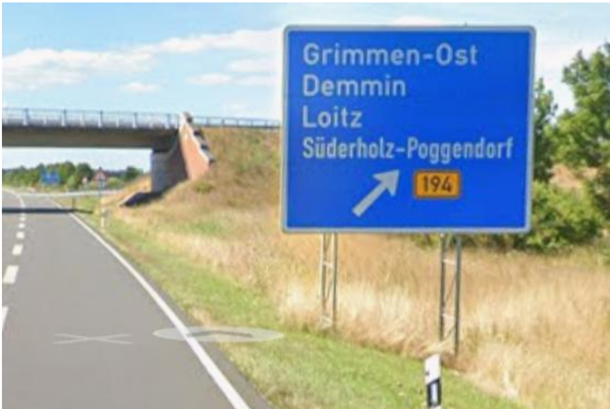
A20 AS Grimmen-Ost Ausfahrt aus östlicher Richtung