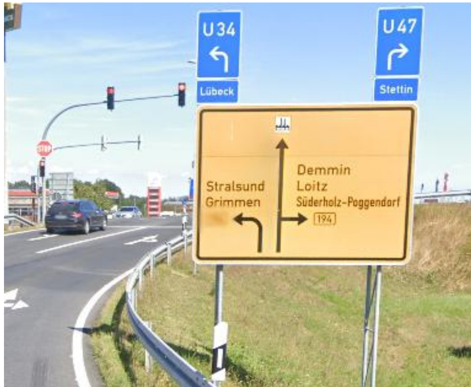
Ausfahrt von der A 20 zur Kreuzung B 194 / Pommerndreieck