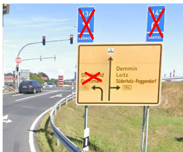
Anlage C 28