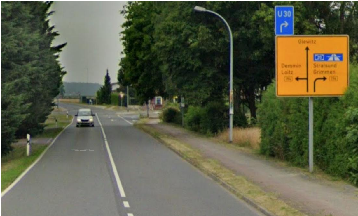
L 26 aus Richtung Kandelin kommend in Richtung Kreuzung Poggendorf