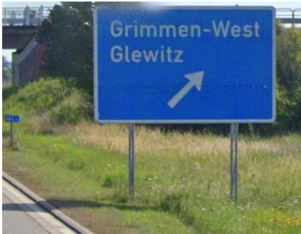
A20 AS Grimmen-West, Ausfahrt aus westlicher Richtung