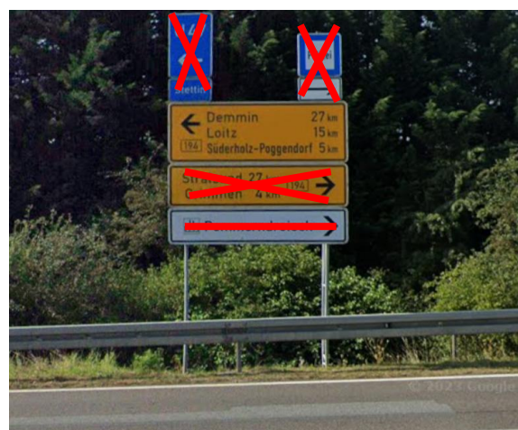
Anlage C 31