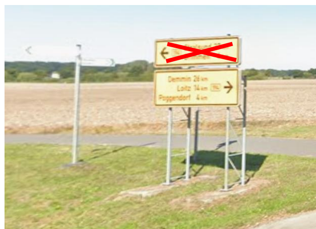
Anlage C 32