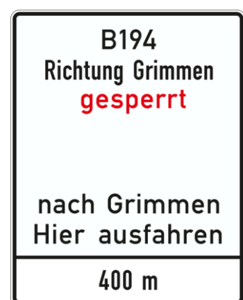
Anlage C 34