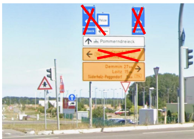
Anlage C 29